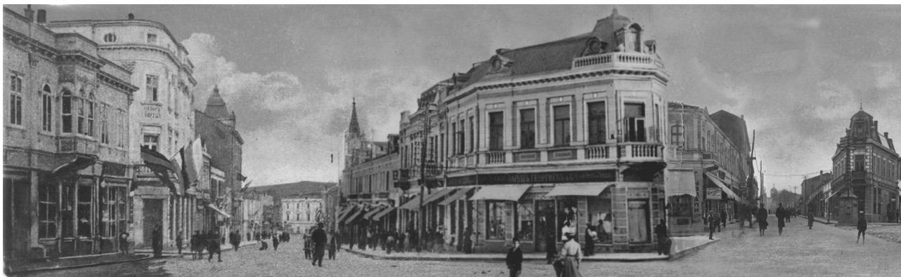
сн. 2. Борислав Петров. Колаж от пощенски картички на улица „Преславска“ (фотографии Гр. Пасков и Атанас Велчев), изработен като амбротипия, вляво в дъното е пл. „Одесос“, вдясно от ъгловото здание следва разклонението към „Малка Преславска“