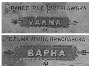
сн. 1. Гръб на паспарту на Е. Ксантопуло от 1897–1908 г. с местоположението на ателието му.