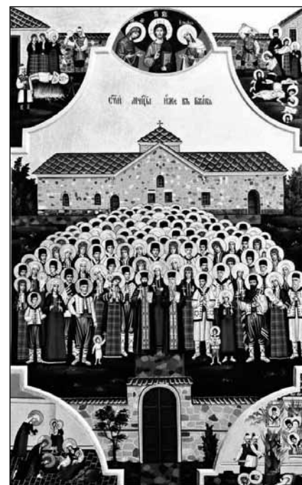
Икона в памет на Новоселското въстание

робство, но от 2019 г. празникът 3 март е Ден на Освобождението (без да се указва нищо повече). В сайта на Народното събрание пък 3 март е обявен като Ден на Освобождението на България от османско иго, може би най-близкото до историческата истина определение, въпреки че за народа и за видни български революционери поробителите са турци, а не османци. Всякакви други термини – „владичество“, „съжителство“ и „присъствие“, са изопачаване на участието на българския народ през петвековния период на потисничество и поругаване на народната памет.