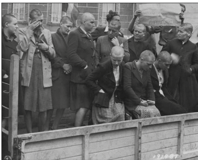
Френско правосъдие – парад на обръснати французойки, които са имали връзки с нацисти

Сравняването на Народния съд с Нюрнбергския процес по отношение на издадените присъди е умишлено лъжливо и в крещящо противоречие с фактите. В Нюрнберг се осъждат само най-висшите нацистки лидери и военачалници от обкръжението на Хитлер. Извън съда в Нюрнберг в стотици други процеси в Германия са осъдени, често със смъртни присъди, десетки хиляди нацисти. Във всяка една от разделените от победителите зони в Германия се провеждат местни съдебни процеси. В Британската, Американската и Френската зона съдии от тези държави осъждат на смърт стотици; само в Дахау американски военен трибунал осъжда 1614 нацистки военнопръстъпници, като на смърт са осъдени близо 400 души. Нацистки лидери, извършили прръстъпления в Полша и в балтийските страни, са изпратени на съд там и екзекутирани.