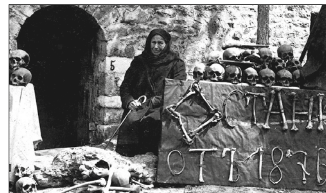
След Баташкото клане

Фелдмаршал Хелмут Молтке, военен съветник на султан Махмуд II през 1836–1839 г., посетил български градове, в писмо от 5 май 1837 г. пише: „От двете страни на улицата една робиня се продава за 100 гулдена, или по-евтино от един катър.“ Френският журналист Иван дьо Вестин описва как при потушаването на Априлското въстание през 1876 г. много жени и деца от района на Копривщица са отвлечени и продадени на тайните пазари в Цариград. По същия начин два века преди това след разгрома на Чипровското въстание през 1668 г. почти цялото население на Чипровци, Копиловци, Железна и Клисурса е отвлечено в робство.