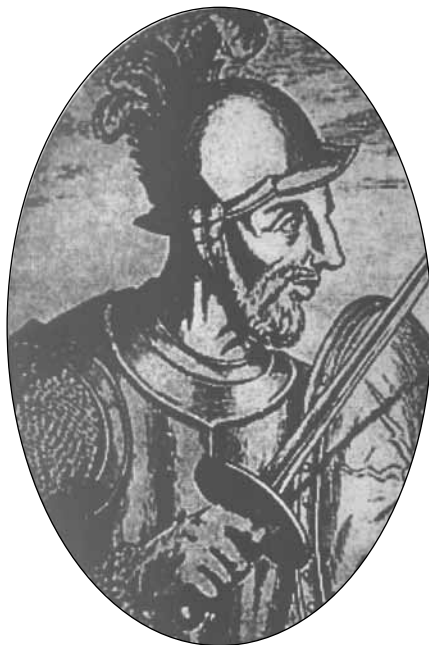
Предполагам портрет на Алонсо де Охеда

Междувременно заседава споменатият „другарски съд“ над Иван Димитров. След бурни дебати СБЖ му налага порицание и препоръка да се откаже от твърденията за българския произход на Алонсо де Охеда. Гора от ръце гласува „за“, неколцина с различно мнение се свиват на столовете.