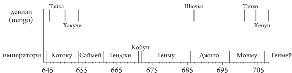
Императори и девизи през втората половина на VII в.

През 645 г. принц Накано Ое убива Сога-но Ирука – събитие, известно в историята като инцидента Исши . Исши е названието на 645 г. по шейсетгодишния цикличен календар. С това се слага край на хегемонията на рода Сога и се възстановява пълнотата на императорската власт. През 649 г. родът Сога слиза завинаги от политическата сцена.