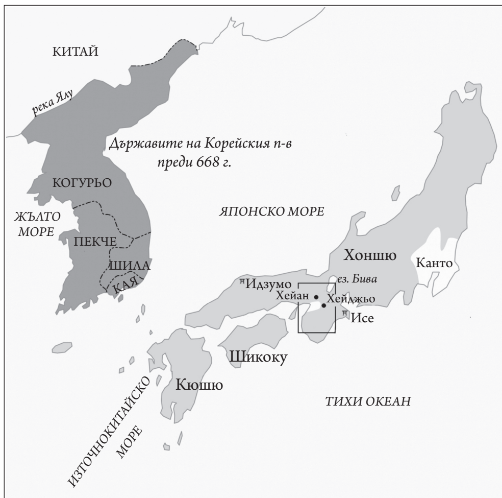
Япония и съседните държави през VII–VIII в.

Старояпонската литература се отнася към VIII в., но тя не може да се разглежда извън контекста на процесите, обхванали цяла Източна Азия под влияние на мощните китайски империи Суй (581–618) и Тан (618–907).